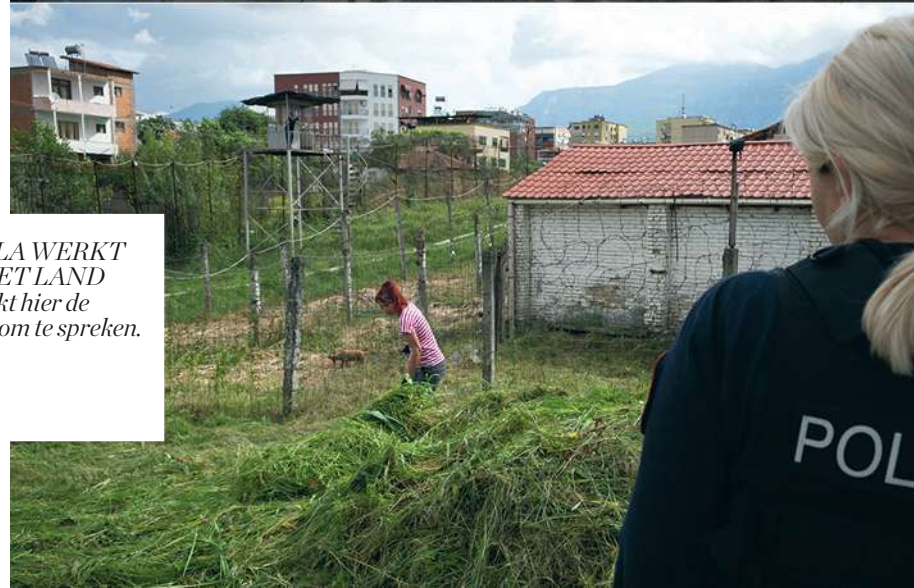
MELLA WERKT OP HET LAND Je ruikt hier de angst om te spreken.

In juni besprak het Europees Parlement de jaarlijkse voortgangsrapportage voor landen die willen toetreden tot de EU. Albanië gooide daarin hoge ogen,