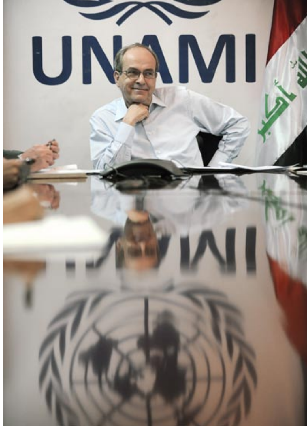
Stafvergadering in het hoofdkwartier van Unami: ‘Hoe staat het met het geweld vandaag?’

Het Unami-team vertrekt naar kantoor. Melkert trekt zich terug in zijn werkkamer. Om tien voor één loopt hij de wenteltrap af. Een Nieuw-Zeelandse beveiliging met een glazen oog loopt voor hem uit. Buiten staan drie gepantserde voertuigen voor. ‘You never walk alone hier,’ zegt Melkert mat. Zijn voorganger Sérgio Vieira de Mello kwam in 2003 met eenentwintig VN-medewerkers bij een bomaanslag op het VN-kwartier om. Unami bracht haar missie terug tot het