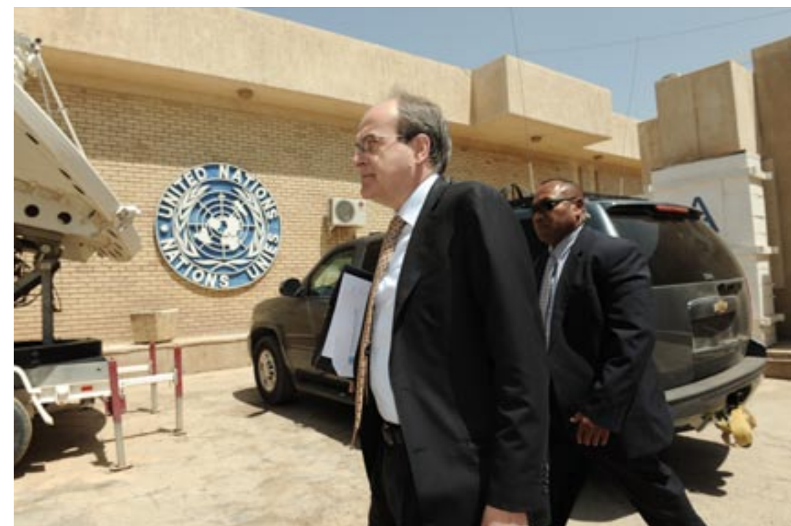
Met bodyguard op weg naar kantoor. 'Er komt een keer een einde aan dit werk'

'Het is nog een jong proces. Maar ik geloof dat er een punt is gepasseerd'